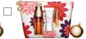
DOUBLE SERUM Double Serum, Beauty Flash Balm & Läppolja