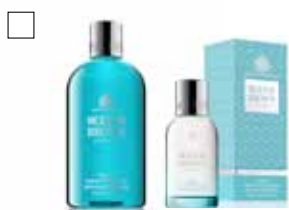
MOLTON BROWN COASTAL Shower Gel 300 ml / Edt 30 ml Pris: 240:-/480:-