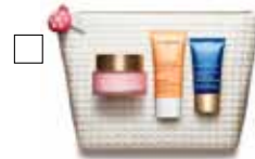
SMOOTH ESSENTIALS Dagkräm, Exfoliating Cleanser & Nattkräm