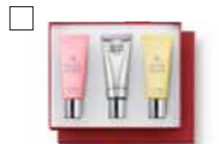
MOLTON BROWN Trippel handkräm