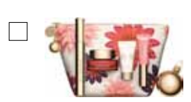
MAKE-UP HEROES Supra Mascara, Instant Smooth, SOS Primer & Lip Perfector