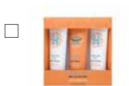
HAPPY NATURALS MINI KIT Bodywash, Bodyscrub & Bodybutter 3x75 ml