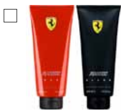
FERRARI Bodywash - Red eller Black Pris: 199:-/st