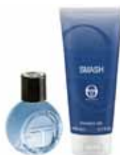
SERGIO TACCHINI - SMASH Giftbox Edt + Showergel Pris: 329:-