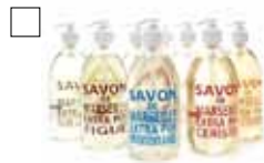
SAVON EXTRA PUR Savon de Marseille - Klassisk Handvål 72% vegetabiliska oljor

Vardagslyx med det lilla extra för ökat välbefinnande