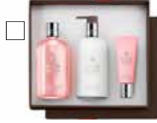
MOLTON BROWN Handkit Handvål + Handlotion + Handkräm