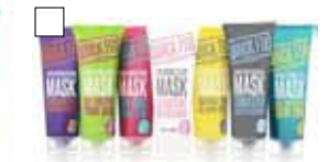
QUICK FIX FACIALS 8 blandade masker