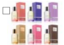
MOLTON BROWN Brett utbud Eau de Toilette