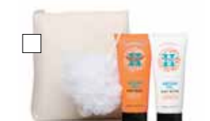
HAPPY NATURALS KIT Bodywash, Skrubball & Bodybutter 2x200 ml