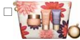
EXTRA FIRMING Dagkräm, Nattkräm/Mask