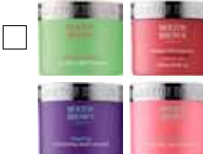
MOLTON BROWN Ljuvliga bodyscrubs