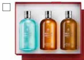
MOLTON BROWN SHOWER TRIO 3x300 ml Pris: 595:- O.p. 780:-