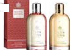
MOLTON BROWN Kropp-/Badoljor

Exotiska och sensuella dofter Pris: 540:-/st