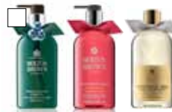
MOLTON BROWN Christmas Edition Handwash / Glittering Champagne Duschgelé