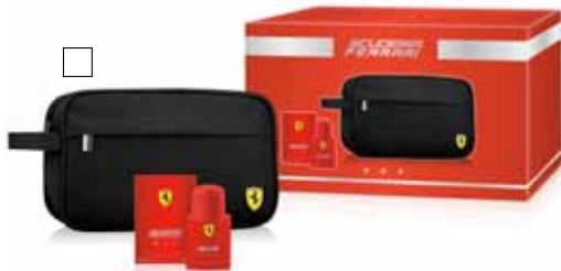
FERRARI Necessär + Edt 30 ml - Red eller Black Pris: 325:-