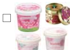
BOMB COSMETICS Välj mellan Showerbutters, Bodyscrubs, Bodybutters & Doftljus