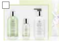
MOLTON BROWN Duschgelé + Bodylotion + Eau de Toilette