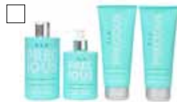
T.I.F PRECIOUS Bodywash / Bodypolish Bodybutter / Bodylotion