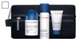
CLARINS BAS-KIT MAN Raklödder, Fuktkräm & Duschgelé Pris: 425:- Värde 635:-