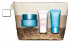
HYDRA ESSENTIAL Dagkräm, Ansiktsskrubb & Fuktmask