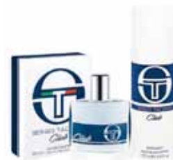
SERGIO TACCHINI - CLUB Giftbox Edt + Deospray Pris: 329:-