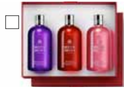
MOLTON BROWN 3x300 ml Duschgelé