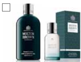
MOLTON BROWN RUSSIAN LEATHER Shower Gel 300 ml / Edt 30 ml Pris: 240:-/480:-

Trendiga och fräscha dofter för henne & honom