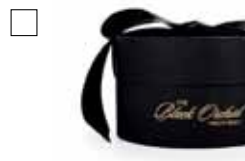
DOFTA The Black Orchid Treatment