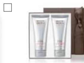
MOLTON BROWN SPORT Bodywash + Bodyscrub 2x200 ml Pris: 420:- O.p. 600:-