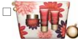
SUPER RESTORATIVE Dagkräm, Nattkräm & Handkräm