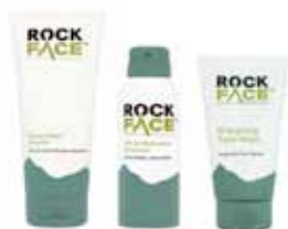
ROCK FACE Bodywash, Bodyspray, Face & Bodyscrub Pris: Duopack 150:-, Styckpris 100:-